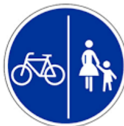
Zeichen 241 Getrennter Geh- Radweg