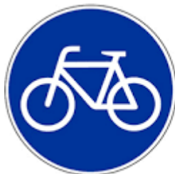
Zeichen 237 Radweg

Muss ich einen Radweg, der mit einem blauen Radwegschild ausgeschildert ist, benutzen?