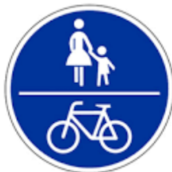
Zeichen 240 Gemeinsamer Geh- Radweg